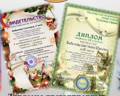
Дипломы дистанционных конкурсов и мастер-классов