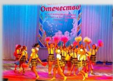
Международный конкурс «Славься, Отечество!»