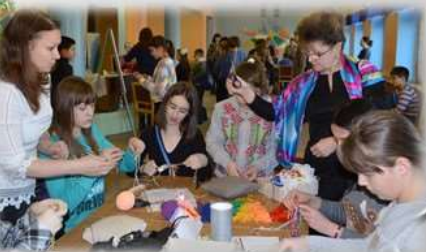
Мастер-класс творческого объединения «Макраме»

Для сбора информации разработаны специальные формы и создана база данных «Одаренные дети».